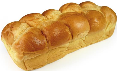
Brioche 700Gr PB 100% naturelle ( Pur Beurre )

(Sans conservateur) (Sans huile de palme) (Arômes naturels) DLC 28 jours