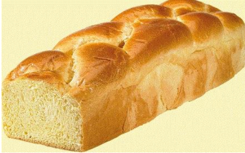
Brioche Vendéenne Tressée main 600 Gr ( Huile de Colza )