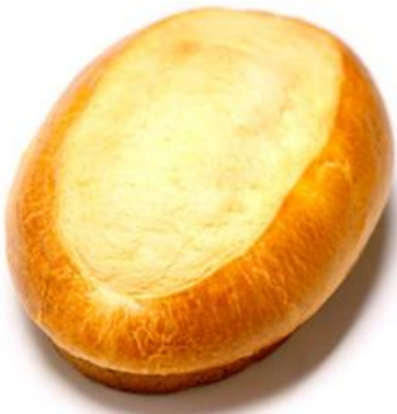
Gâche Vendéenne PB 500 Gr ( Pur Beurre : 10% ) ( Crème fraîche )